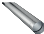
Nedløbsrør Standard Ø76 Zink. Enhed å 2 m. el. 3 m.