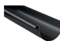
Tagrende 11" Alu, sort, struktur / 3D