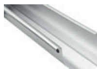
Tagrende Arkitekt 333 - Alu, blank