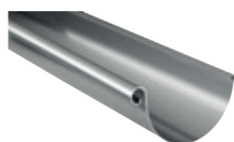
Tagrende Standard 11" halvrund. Zink.