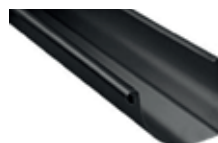
Tagrende Arkitekt 333 - Alu, sort, struktur/3D