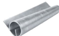
Samle vulst Zink